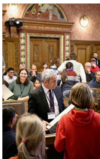
Viele Wünsche an Atici.

Die erste Gruppe nennt sich «Idea Maximus». Sie wünschen sich Spielplätze für 8- bis 13-Jährige – in jedem Quartier. Aus Korken, Tannenzapfen oder Karton haben die Kinder ihre Traumspielplätze gebaut.