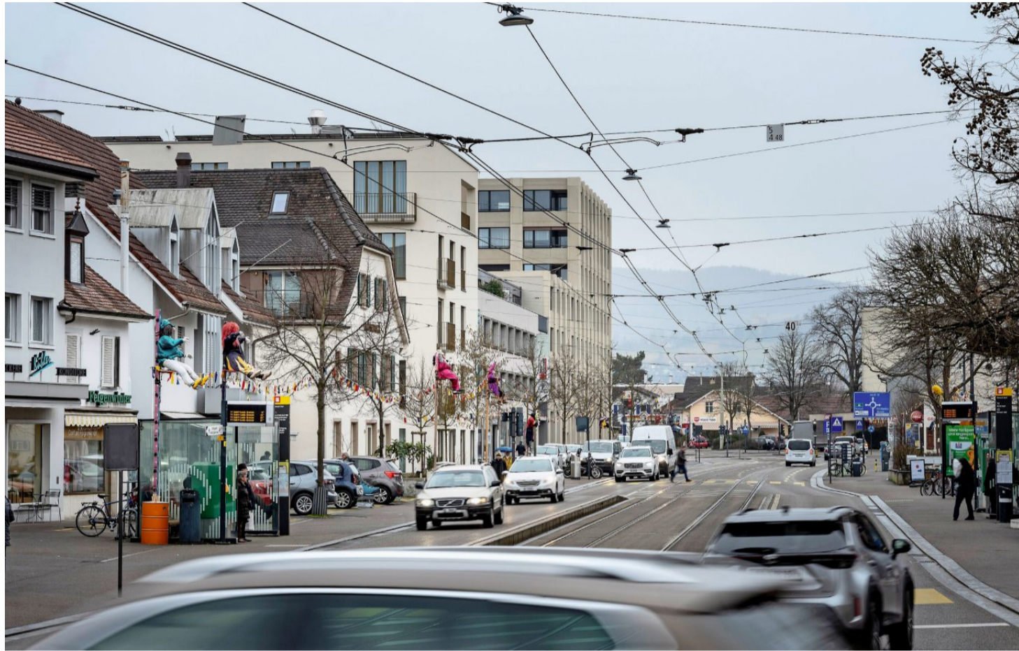
Die neue Umfahrung Süd soll Reinach im Birstal (Bild) direkt mit Liestal im Ergolzthal verbinden.

Südumfahrung, Umfahrung Süd – das klingt so ähnlich, dass auch Medienschaffende verwirrt waren. Im November berichtete zum Beispiel die «Basler Zeitung» bemerkenswert zaghaft darüber, dass es eine andere Routenführung geben soll. Und auch die Autoren dieser Zeitung fragten sich erst einmal: Ist das jetzt etwas Neues oder geht's hier um das Alte? Die genaue Lektüre zeigt zwar klar, dass diese neue Umfahrung Süd das Birstal mit dem Ergolzthal verbinden soll. Aber das ist so dezent,